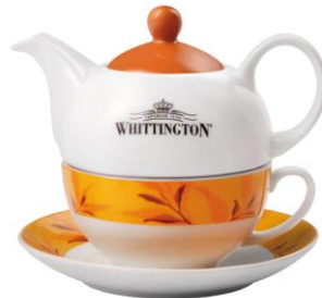
Bild 02 Kombination aus Teetasse und Kännchen